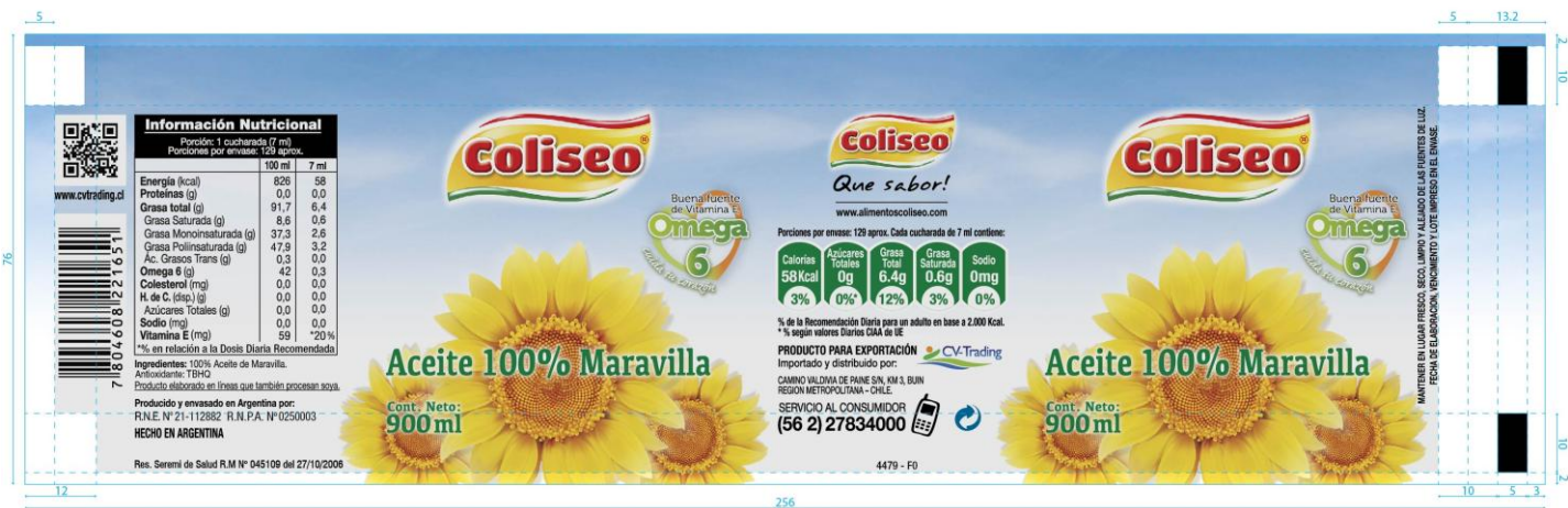
FOTO DEL PRODUCTO