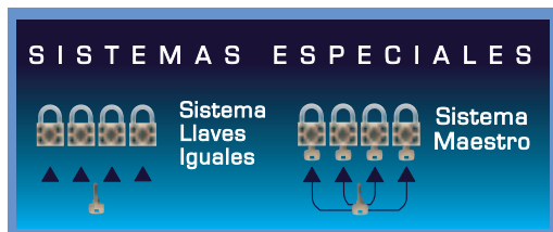
Imagen de igualamiento y amaestramiento