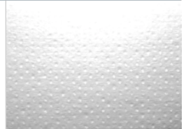
LÁMINA TERMO- RETRÁCTIL

PAPEL SUAVE Y RESISTENTE DE MUY BUENA ABSORCIÓN