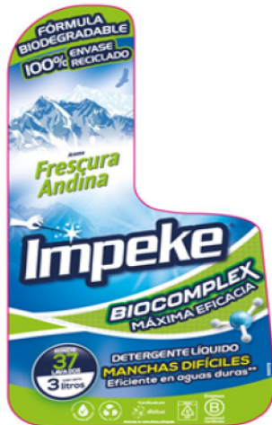
Front 108 mm 198 mm