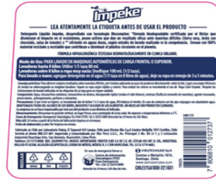
back 105 mm 100 mm