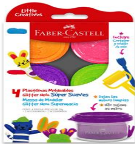
FOTO DE PRODUCTO